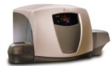
Серия Cytomics™ FC 500