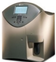
Coulter® Ac•T™ 5diff OV