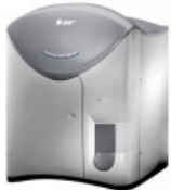
Coulter® Ac•T™ 5diff CP