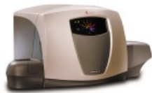
Серия Cytomics™ FC 500