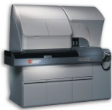
UniCel® DxI 800