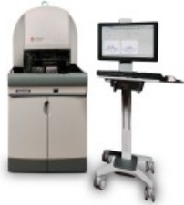
UNICEL® DXH 800 COULTER®