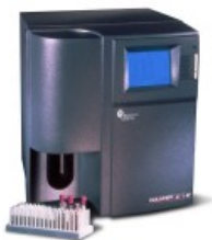
Coulter® Ac•T diff™

Адрес: Москва, ул. Руставели, д. 14, стр.6