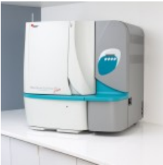
MicroScan WalkAway plus System