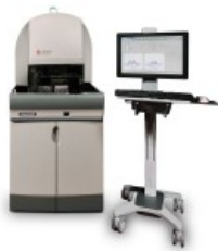
UNICEL® DXH 800 COULTER®