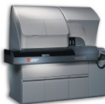
UniCel® DxI 800