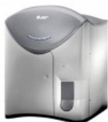
Coulter® Ac•T™ 5diff CP