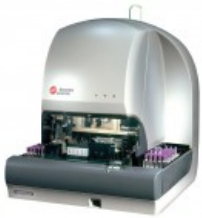
UNICEL® DXH 600 COULTER®