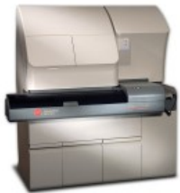
UniCel® DxI 600