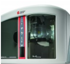
Multisizer™ 4 COULTER COUNTER®