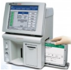
Gem Premier 3000