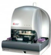
UNICEL® DXH 600 COULTER®