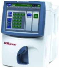
Gem Premier 4000