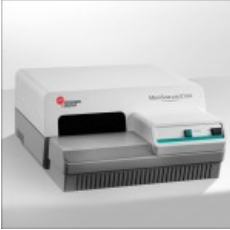
MicroScan autoSCAN-4 System