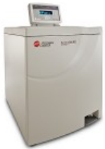
Avanti® J-26S XP