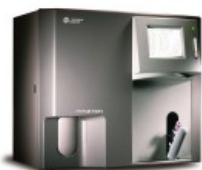
Coulter® Ac•T diff 2™