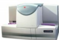
Coulter® Ac•T™ 5diff AL