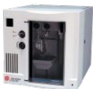
Multisizer™ 3 COULTER COUNTER®